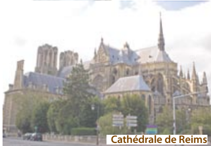
Cathédrale de Reims