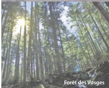
Forêt des Vosges