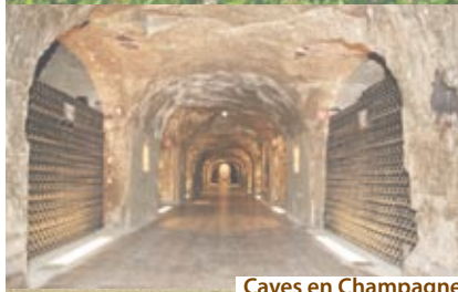
Caves en Champagne