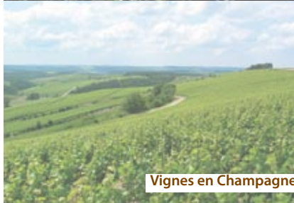
Vignes en Champagne