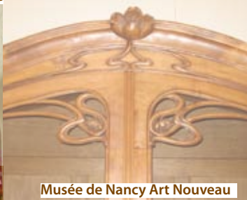
Musée de Nancy Art Nouveau