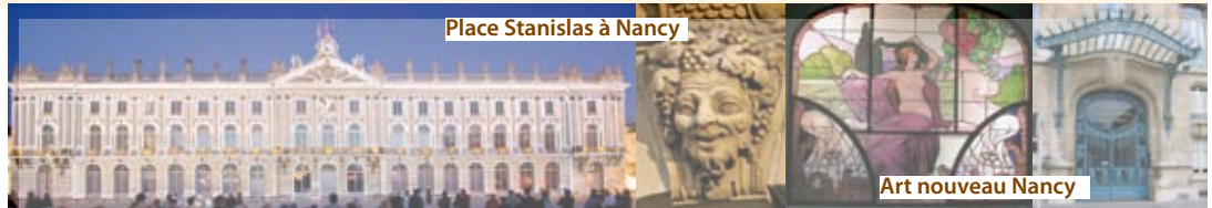
Place Stanislas à Nancy