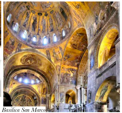
Basilica San Marco