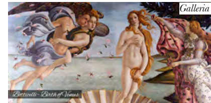
Botticelli Birth of Venus