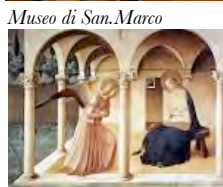
Museo di San Marco