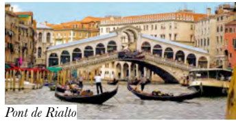
Pont de Rialto