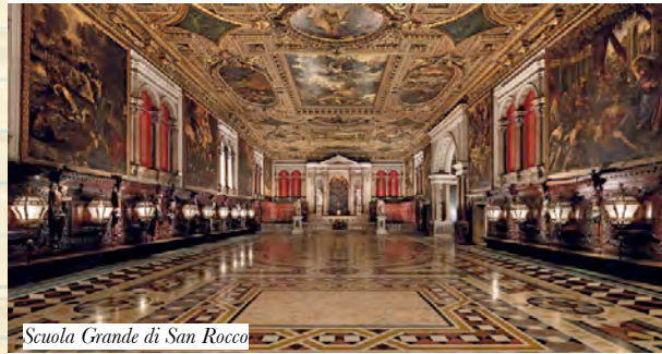
Scuola Grande di San Rocco